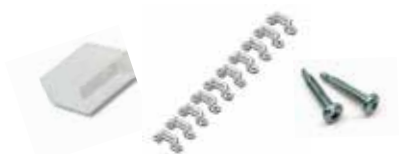
ZGC301 MOUNTING KIT RGB

端盖*1 安装固定支架*20 不锈钢螺丝*40 1包配件仅满足1卷灯带（5m）使用