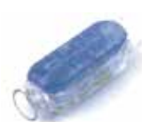
ZGC 301 IP connector

端盖*1 安装固定支架*25 不锈钢螺丝*50 1包配件仅满足1卷灯带（5m）使用