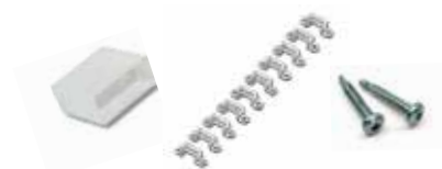
ZGC301 MOUNTING KIT MONO

端盖*1 安装固定支架*25 不锈钢螺丝*50 1包配件仅满足1卷灯带（5m）使用